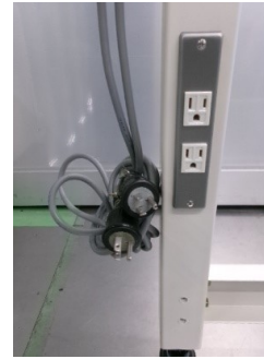
(外部コンセント2口 : 個別配線)